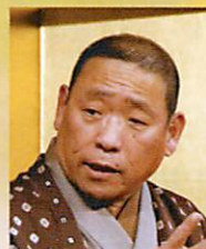
落語家 笑福亭 松喬