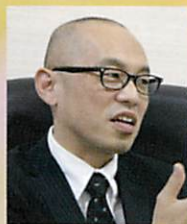
相愛大学 釈 徹宗